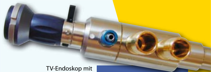
TV-Endoskop mit Wasser- und Schweißfiltereinbauten Objektiv-Blickrichtung 90° mit wechselbarem Saphir-Schutzglas und Freiblasvorrichtung

ViSiTOOL bietet Ihnen heute die Visualisierung von morgen.