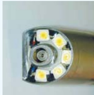
Sonderendoskop mit LED-Beleuchtungskopf