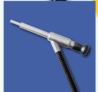
TV-Endoskop mit separatem Lichtrohr mit hohem Faseranteil für gezielte Streiflichtbeleuchtung