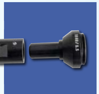
Optik mit Bildfeld Ø 6,5 mm und 90° Prismenaufsatz