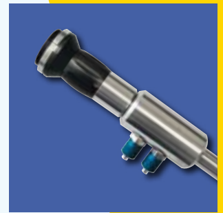
TV-Sonde mit Ø 14 mm ohne Faserbeleuchtung, mit Wasserkühlung temperaturfest bis 1200° C

Als TV-Sonden bezeichnet man Endoskope, die kein Augenokular für eine visuelle Betrachtung haben, sondern ein C-Mount-Gewinde zum direkten Anschluss an eine Kamera. Hierbei kann das Endoskop starr oder flexibel ausgeführt sein. Auch hier sind sehr kleine Durchmesser zu realisieren, um an unzugänglichen Stellen ein Bild aufzunehmen. Anwendungsbezogen können der Durchmesser des Endoskops, Länge, Größe des zu betrachtenden Objektfeldes, Blickrichtung sowie der Arbeitsabstand frei gewählt werden. TV-Sonden können druckdicht für alle Medien, temperaturfest oder strahlenresistent ausgeführt werden.