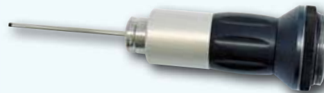
TV-Mikrosonde mit Ø 1,9 mm ohne Faserbeleuchtung, mit 90° Seitblick