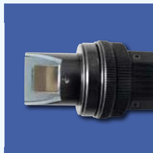
Sonderoptik mit 45° Seitblick